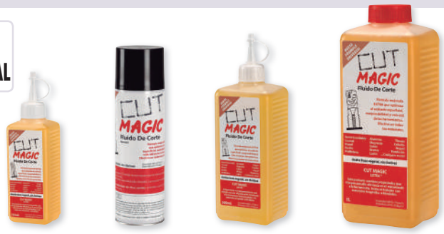
Ref. AC00250 Ref. AC00300AERO Ref. AC00500 Ref. AC10000