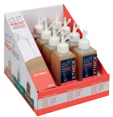
EXP-ACXT00250 8 U. x 250ml. 154,92 € 200 x 180 x 240mm