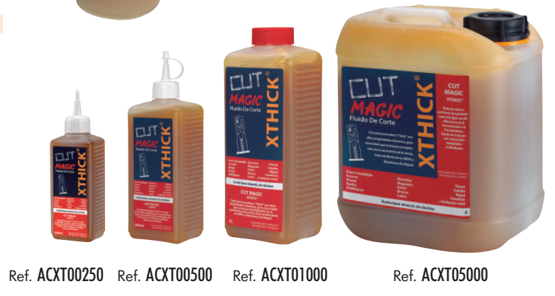
Ref. ACXT00250 Ref. ACXT00500 Ref. ACXT01000 Ref. ACXT05000