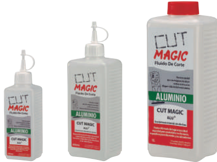
Ref. ACAL00250 Ref. ACAL00500 Ref. ACAL01000