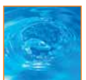
Resistencia al agua