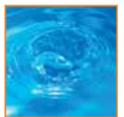
Resistente al agua