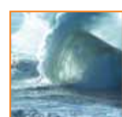
Resistente al agua