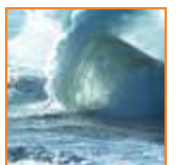
Resistente al agua