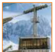
Instalaciones de montaña