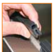
Montaje y mantenimientos de juntas